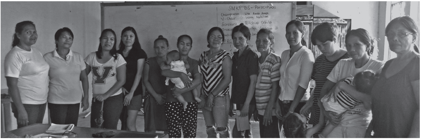
TAMPOK SA LARAWAN Mga bagong halal na opisyal ng SMKP - Bagong Silangan Chapter

Diyos. Ang kadakilaan ng Diyos ay higit pa sa mga kasalanan nating lahat. Napatunayan niya ito nang magkasala sina Eba at Adan. Hindi niya pinabayaan ang sangkatauhan bagkus iniligtas niya ito sa harap ng grabeng kasalanan. Ang tugon ng Diyos ay habag. Mababasa rin natin sa Bibliya ang tungkol sa alibughang anak: nagsisisi at bumalik sa kanyang ama. Inilarawan kung paano siya tinanggap ng ama ng buong puso. Pinaghanda at binihisan ng maayos. Ang kwento ay sumasalamin sa habag ng Diyos. Ganoon din ang babaeng nahuli sa pakikiapid, di binato ni Hesus gaya ng nasasaad sa kautusan ng mga Hudyo. Pinatawad niya at sinabihang huwag nang magkasala.